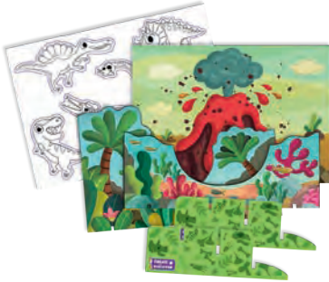
Láminas escena 3D 3D-omgevingsstukken Scènes en 3D Peças de cena 3D 3D-Teile der Umgebung