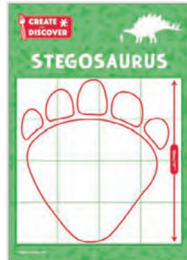
Poster de huellas Poster met voetafdrukken Poster de l'empreinte Cartaz da pegada Fußabdruck- Poster