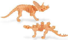
Esqueletos Dinosaurus- skeletten Squelettes de dinosaures Esqueletos de dinosauros Dinosaurier- Skeletten