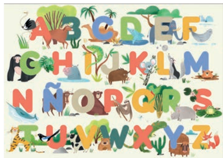
gráfico: la letra. Durante esta actividad podemos describir las características de las distintas letras: la «O» es como un círculo, la «S» parece una serpiente...

3. Familiarizarse con los sonidos de las letras. Desplegar el póster junto a las letras mayúsculas troqueladas. Nombrar en voz alta los distintos animales y colocar la letra inicial de cada uno encima del póster. Al principio, usamos el sonido de la letra, y no su nombre, para que el niño haga la conexión entre el fonema y la grafía (la letra «bbb», la letra «sss», etc.). De ese modo conectará los diferentes sonidos que escucha a su signo